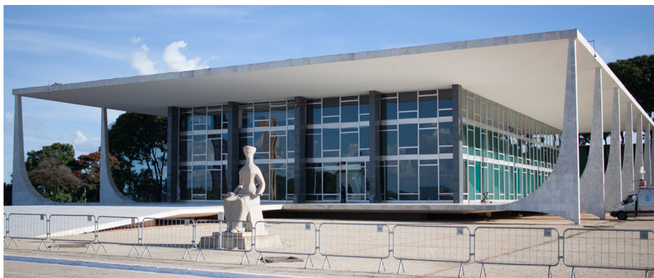
STF - Supremo Tribunal Federal

O Supremo Tribunal Federal (STF) tem exercido um papel cada vez mais central no cenário político brasileiro, decidindo sobre temas que, em muitos países, caberiam ao Poder Legislativo. Esse protagonismo tem gerado um intenso debate sobre os limites da atuação do Judiciário e sua influência no equilíbrio entre os Poderes. Até que ponto o STF está apenas cumprindo sua função constitucional e garantindo direitos, e quando passa a atuar em uma esfera que deveria ser do Congresso Nacional?